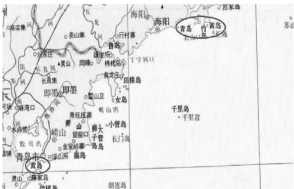
图2 《中国历史地图集》(清·山东省) 中的“黄岛” [23] 22-23