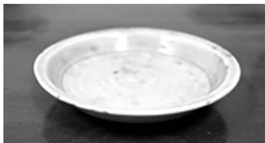
图3 影青釉葵瓣卧足盘

为商品贸易的钱币，梧州元丰钱鉴铸造的钱币因桂滇线茶马古道线路的繁荣而得到了广泛流通。元丰钱鉴遗址位于梧州市钱鉴路的桂江河畔，发掘于1965 年 8 月，是一处规模较大、功能较完善的宋代铸钱遗址，出土有宋神宗的熙宁重宝、元丰通宝，徽宗的崇宁重宝（见图4）、崇宁通宝等一批钱币，伴随出土的还有铸钱工具如坩埚（见图5）、风管等。元丰钱鉴所铸造的钱币，在滇黔地区也经常出土，说明梧州元丰钱鉴铸造的钱币，曾因滇桂线茶马古道的繁荣而得以更广泛流通使用。