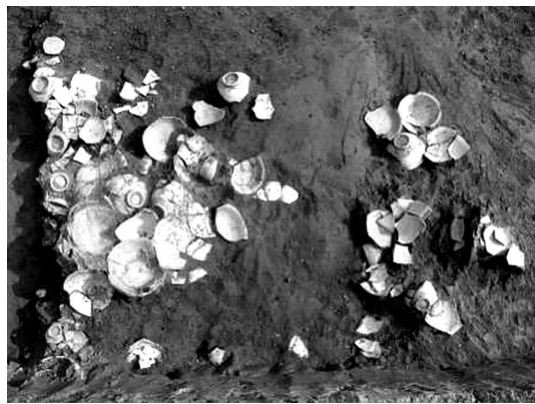
图2 横山寨古城出土的瓷器

特磨道、大理国等。在马市的同时，横山寨也带动了其他日用商品的交换。“蛮马之来，他货亦至。蛮之所贡，麝香、胡羊、长鸣鸡、披毡、云南刀及诸药物。吾商贾所贡，锦缯、豹皮、文书及诸奇巧之物，于是译者平价交市，招马官乃私置场于家，尽揽蛮市而轻其征，其入官场者，什纔一二耳。” [6] 另外，从考古发掘来看，大量的出土物为横山古寨作为宋代西南地区重要的贸易集散地提供了实物证据。如2011年3月发掘的百银城址是宋代横山寨的治所，位于现今百色市田东县祥周镇百银村。其城内出土了大量的瓷器（见图2），主要有青瓷和青白瓷两大类，也有少量黑釉的兔盏等，生产的窑口有江西景德镇、吉州窑，浙江龙泉窑，福建莆田窑，广西藤县中和窑、北流岭峒窑、浦北土东窑、兴安严关窑。其中第12号探方出土的北流岭峒窑的瓷器，数量达150余件，集中堆放，贸易性质较为明显。另外还出土了“皇宋通宝”“圣宋元宝”“元丰通宝”“熙宁通宝”等宋代钱币。（可参见广西文物保护与考古研究所、田东县博物馆相关资料）横山寨治所百银城址出土的这批来源广泛的瓷器说明了当时该城址的商品贸易应当非常繁荣，是一个重要的货物商品集散地。